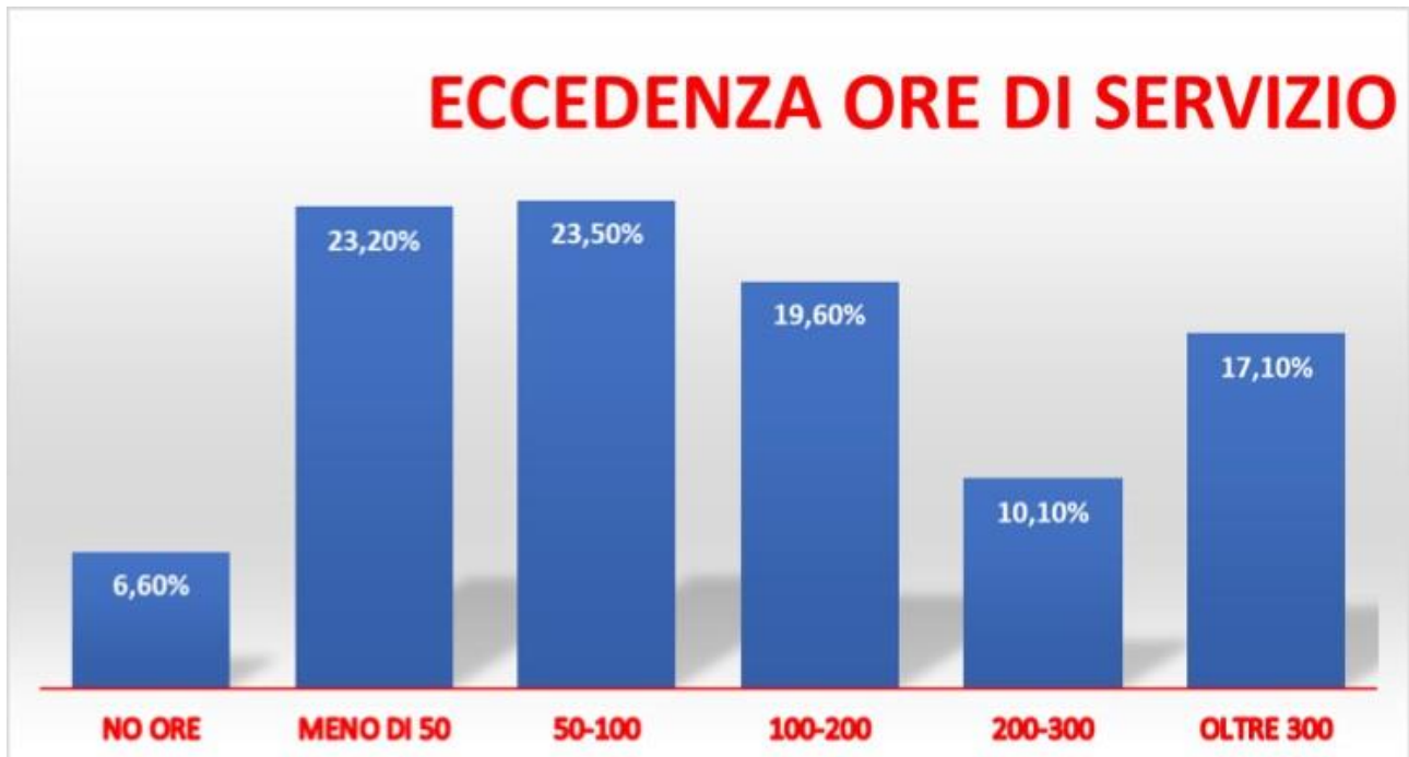
Tabella 3 - Impatto del lavoro sulla vita privata